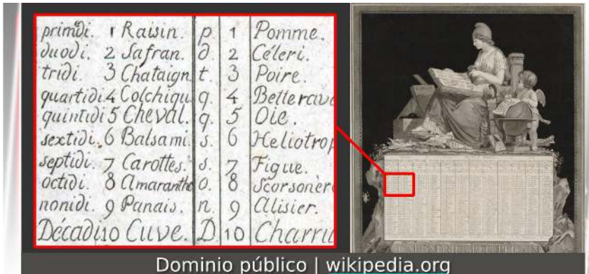
Dominio público | wikipedia.org

Escudriñando la palabra Shavuot resulta interesante que no sólo significa semanas, sino que está relacionada con la palabra para el número siete , la cual es Shevá ; y Shavúa es una semana. Ambas comparten la misma raíz, esto lo dispuso así El Creador. La semana por definición no puede tener seis días o diez días como lo quisieron hacer en Francia hace algunos cientos de años.